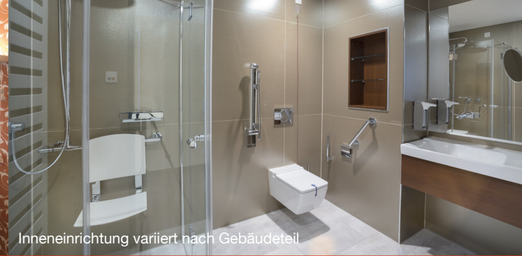
Inneneinrichtung variiert nach Gebäudeteil