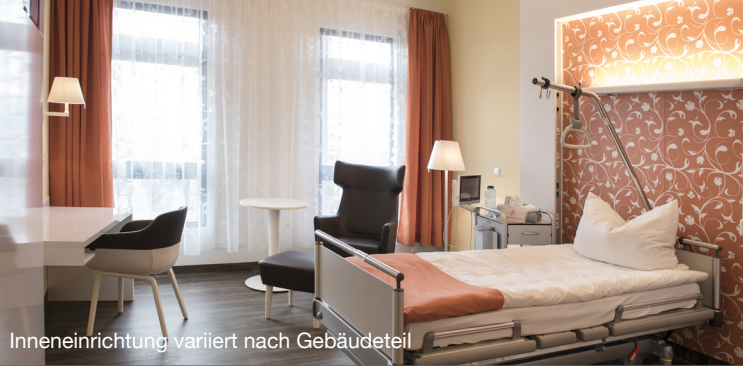
Inneneinrichtung variiert nach Gebäudeteil